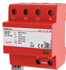
Az ábrák nem kötelező érvényűek